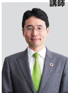
株式会社 ユーグレナ 代表取締役社長