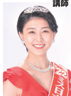
2022 ミス日本グランプリ